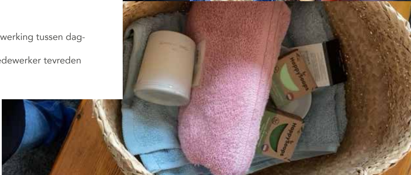
Het duurzame kerstpakket: Plastic vrij!