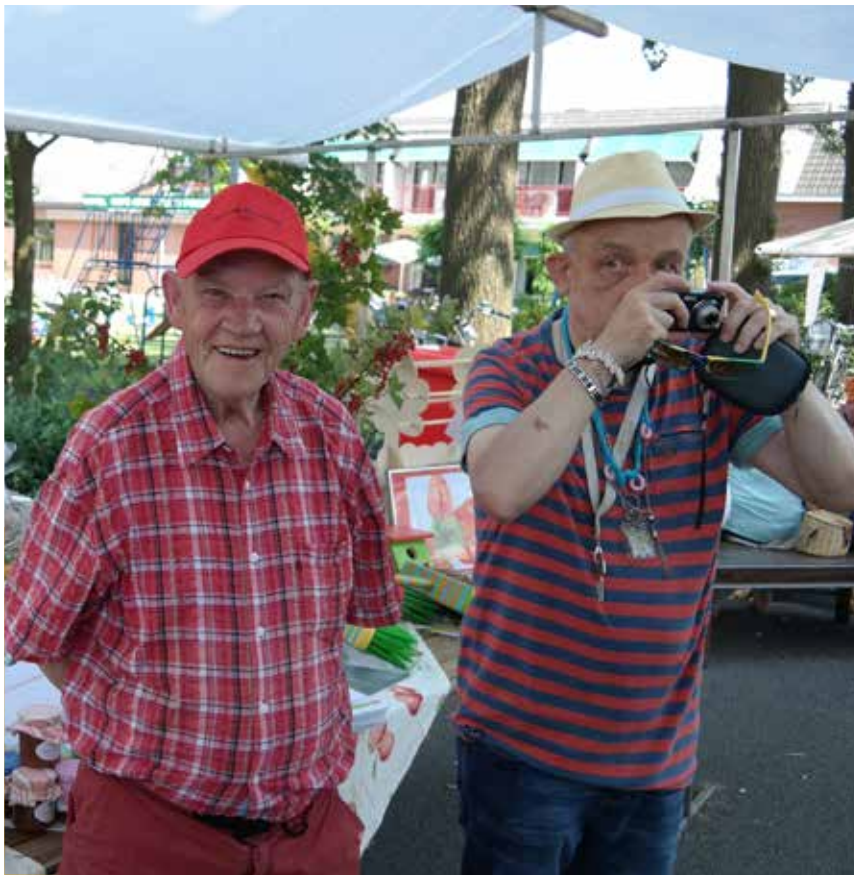
Op stap met de groep

Veel bewoners gaan zelf op vakantie, met hun familie of met een organisatie. Er zijn een aantal bewoners die daar moeite mee hebben. Voor deze groep organiseren we zelf een vakantie. Met onze eigen, goed bekende begeleiding. Dat voelt veilig. Het hoeft ook niet altijd ver weg te zijn, er even op uit, met de vertrouwde mensen om zich heen, kan dan al puur genieten zijn!