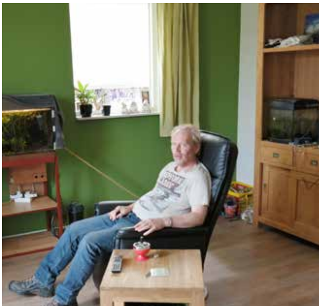
Genieten in het fijne eigen appartement

Samenwerking met ouders, familie en vrienden is belangrijk. De Berkelhof is slechts een onderdeel van het leven van deze jongere mensen. Mantelzorgers blijven betrokken en er wordt samen overlegd wat bij iedereen het beste aansluit. Er zijn dus nu zeventien bewoners.