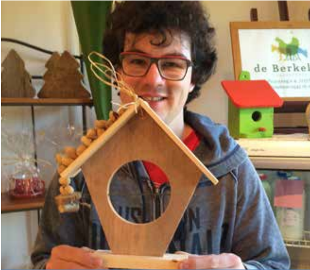
Trots op zijn werk!