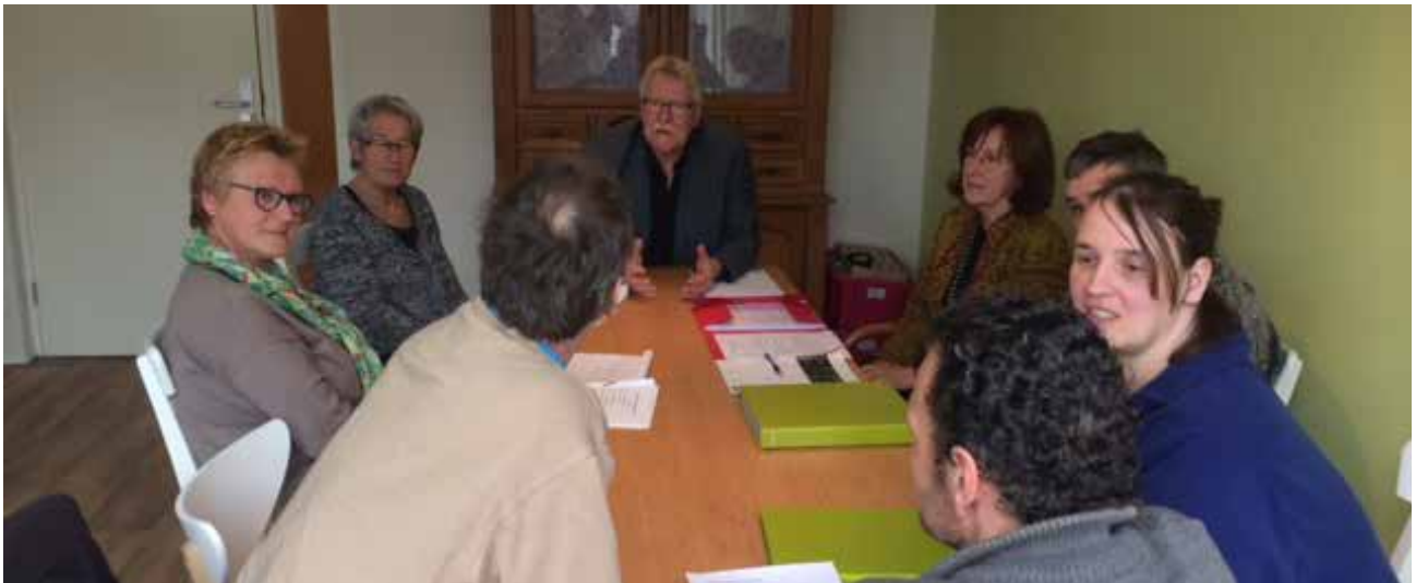
Cliëntenraad in overleg met leden van de RVT

Minimaal vier keer per jaar komt de cliëntenraad bij elkaar, waarvan de directeur bestuurder drie keer aanwezig is. Binnen onze kleinschalige organisatie is er geen ander organisatieniveau. Eén keer per jaar gaat de Raad van Toezicht (RVT) in gesprek met de cliëntenraad.