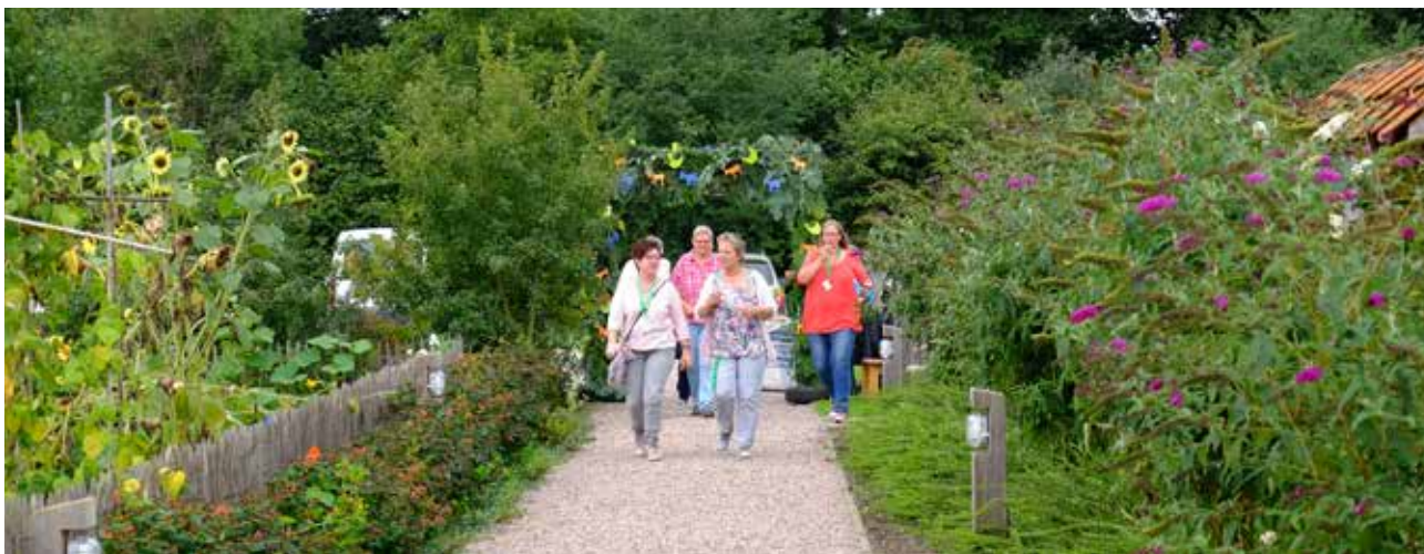
Enthousiaste medewerkers arriveren op hun werk

In 2015 is er niets veranderd in de organisatiestructuur.