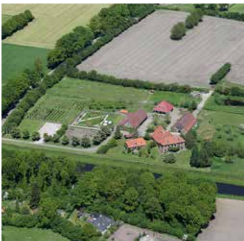
De Berkelhof 2015