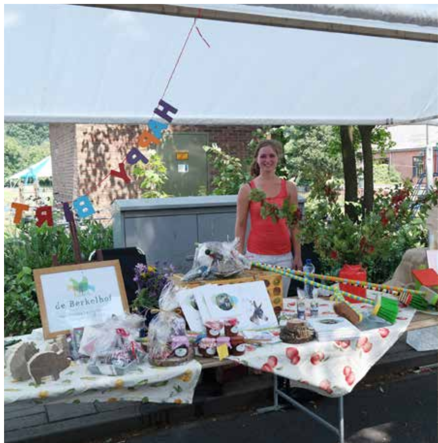
Zomerfeest in Haarlo en wij doen mee!

De winkel, de zintuigentuin en het beleven van de dieren hebben de drempel om naar De Berkelhof toe te komen duidelijk verlaagd. De deelnemers en bewoners zelf zijn veel in het dorp te zien. Zij wandelen met de dieren, bezoeken de markt, gaan koffie drinken of een ijsje eten bij het café restaurant, maken een praatje tijdens het sport-café in het Kulturhus en bezoeken een dienst in de kerk. Er is gesprek en uitwisseling. Dorpsbewoners zijn open en tonen begrip als een bewoner van De Berkelhof iets anders doet dan dat zij gewend zijn. Als het maar bekend is.