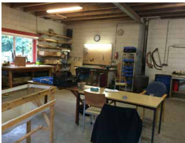
De oude werkplaats

Gedurende het jaar is gebleken dat er een herindeling moest komen in de werkschuur. Er is een tussenwand geplaatst om het werken in twee kleinere groepen mogelijk te maken. Verder is er nu ook een extra raam, waardoor doorkijk naar de winkel mogelijk is, zodat de begeleiding van deelnemers die daar bezig zijn geoptimaliseerd kan worden.