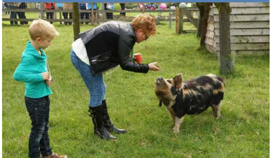
Varkens blijven leuk