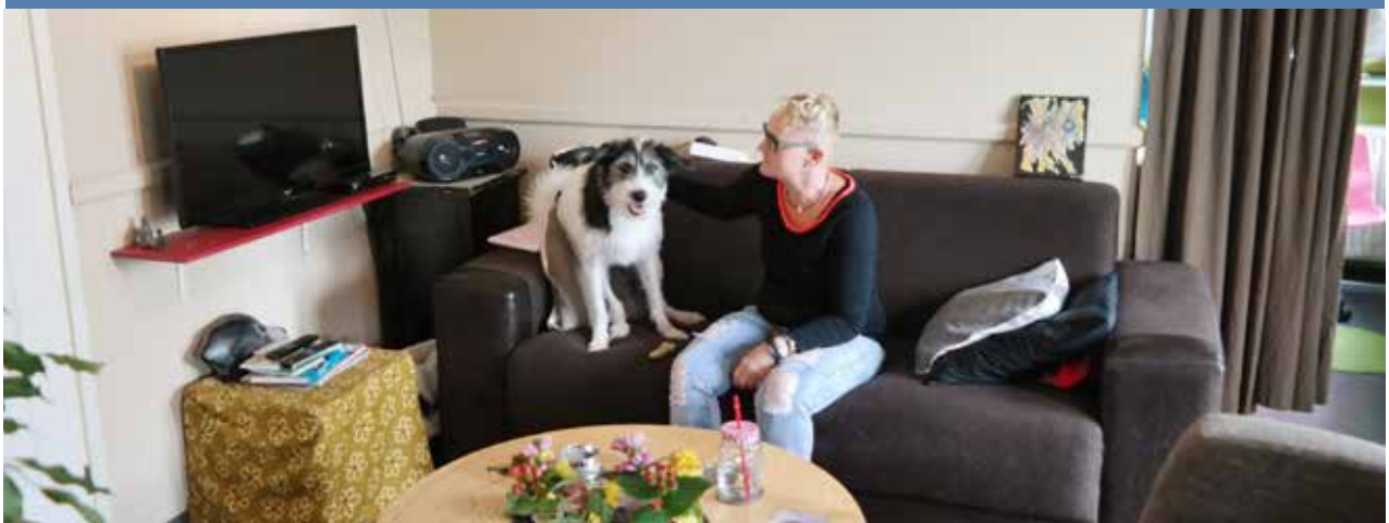
In het eigen appartement mag de hond op bank...