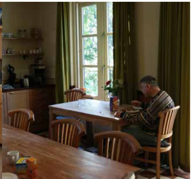
Een rustig ontbijt in de woonkeuken