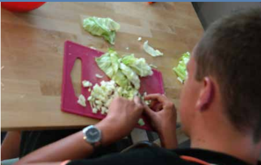
Groenten snijden voor in de soep