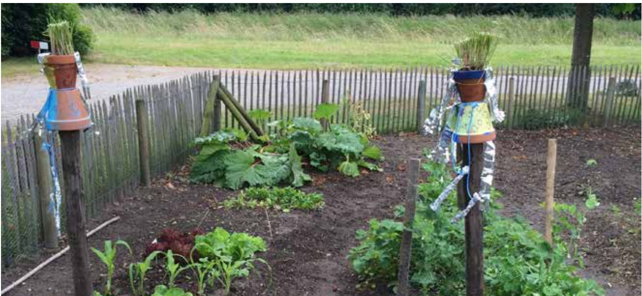
Het tuintje van de stageklas speciaal onderwijs de Triviant

Ook bij de dagbesteding komen er meer jongere deelnemers. Dit heeft onder andere te maken met de samenwerking met het speciaal onderwijs. De scholieren van de Triviant kunnen stage lopen op De Berkelhof en willen dan soms ook na hun schoolperiode blijven komen bij de dagbesteding van De Berkelhof.