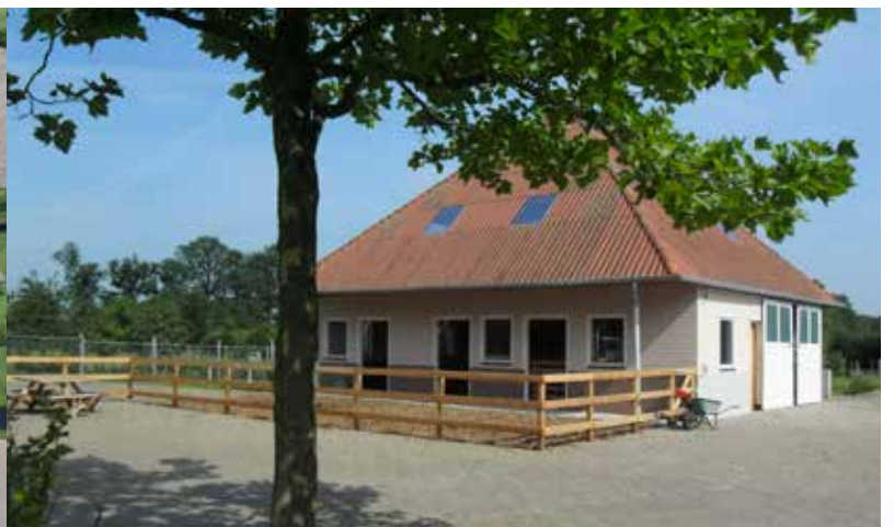
De mestopslag is de nieuwe dierenstal geworden