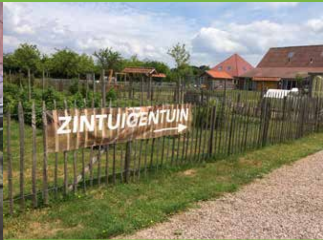
Ponyweide is opeens een zintuigentuin