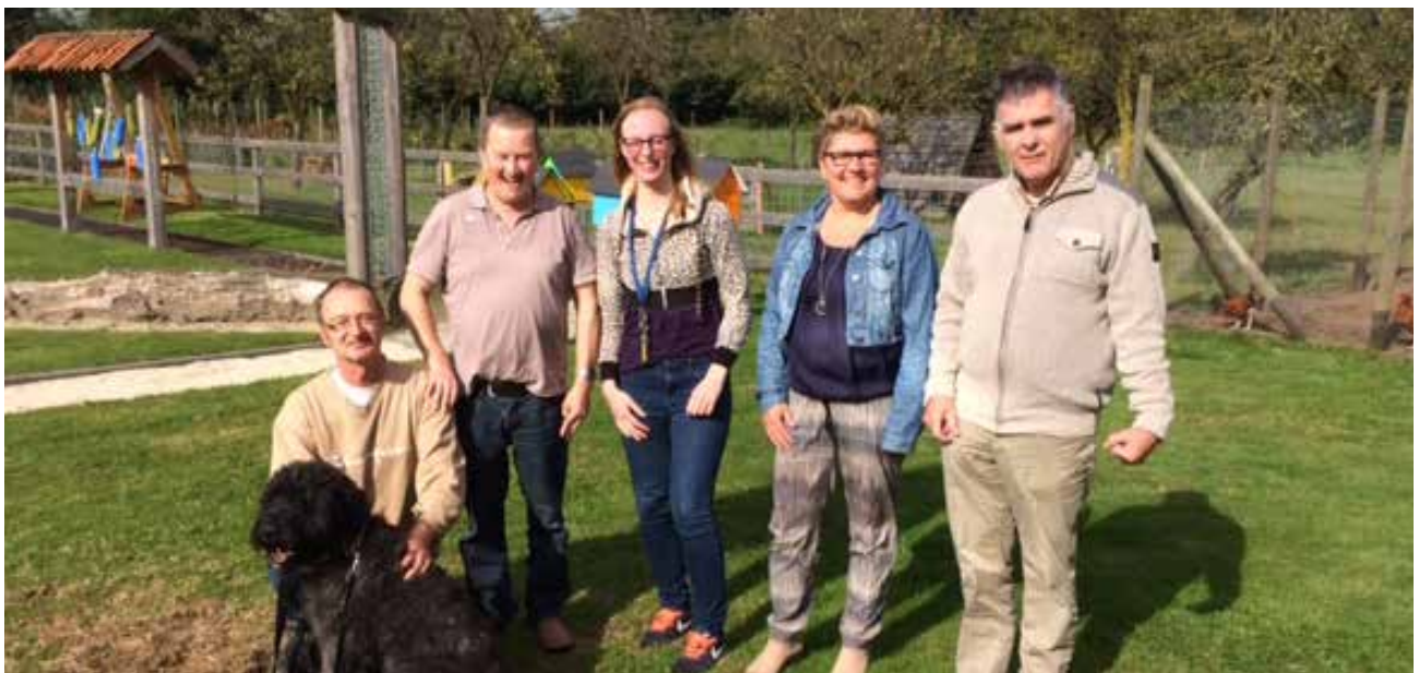
Leden van de cliëntenraad met bezoekers van een andere cliëntenraad

Verder heeft de cliëntenraad zich geïnformeerd hoe andere cliëntenraden het doen. Er vond een uitwisseling plaats met een andere cliëntenraad.