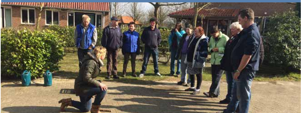
De cursisten van de tilcursus (deelnemers) luisteren naar de uitleg van de fysiotherapeute