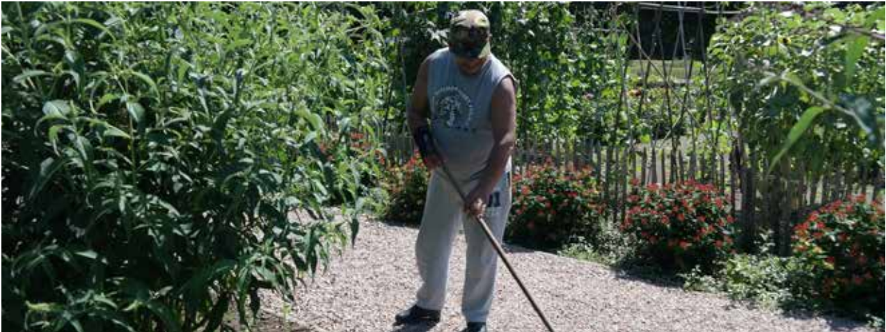
Onderhoud van het erf is veel werk

In het begin van 2015 waren er 27 deelnemers op de dagbesteding, waarna er gedurende het jaar vier zijn gestopt en vier zijn bijgekomen. Dit hield het aantal uiteindelijk gelijk.