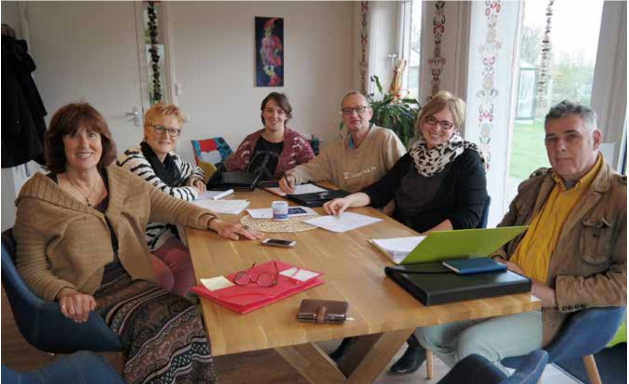
Cliëntenraad in overleg met de directeur. Onderwerp: zorgplan in begrijpelijke taal!