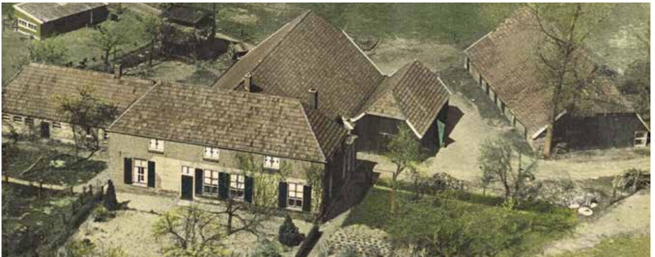
De oude boerderij