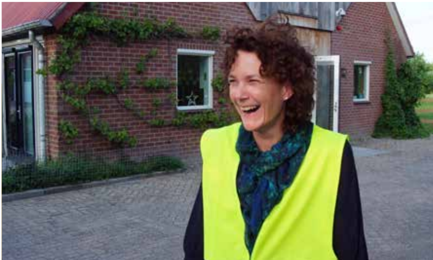
BHV-er aan het werk

Er worden met regelmaat ontruimingsoefeningen gepland en vervolgens samen gehouden. Het is belangrijk om dit iedere keer weer te herhalen. Op verschillende tijdstippen en bij verschillende situaties. De ene keer bijvoorbeeld in het appartementengebouw, de andere keer in het hoofdhuis. Iedereen moet weten wat hij/zij moet doen, maar iedere situatie is dan ook net weer anders. Daarom wordt tenminste twee keer per jaar geoefend en vervolgens wordt besproken wat er gebeurd is. Soms helpt een externe adviseur, soms de brandweer. Belangrijk is om juist te handelen, maar ook om niet bang te worden. Juist met nieuwe deelnemers en bewoners vraagt dit bijzondere aandacht!