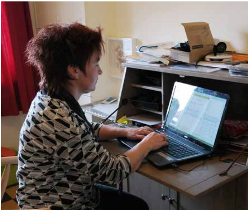
Begeleider werkt even de rapportage bij

Dit is leuk, en om het leuk te houden hebben wij in 2015 afspraken gemaakt. Foto's mogen niet zomaar op het web geplaatst worden. Informatie over deelnemers en bewoners al helemaal niet. Soms is het goed bedoeld, maar we doen het niet. Ook deelnemers onder elkaar niet. Soms helpt de begeleiding om goed te leren met deze dingen om te gaan.