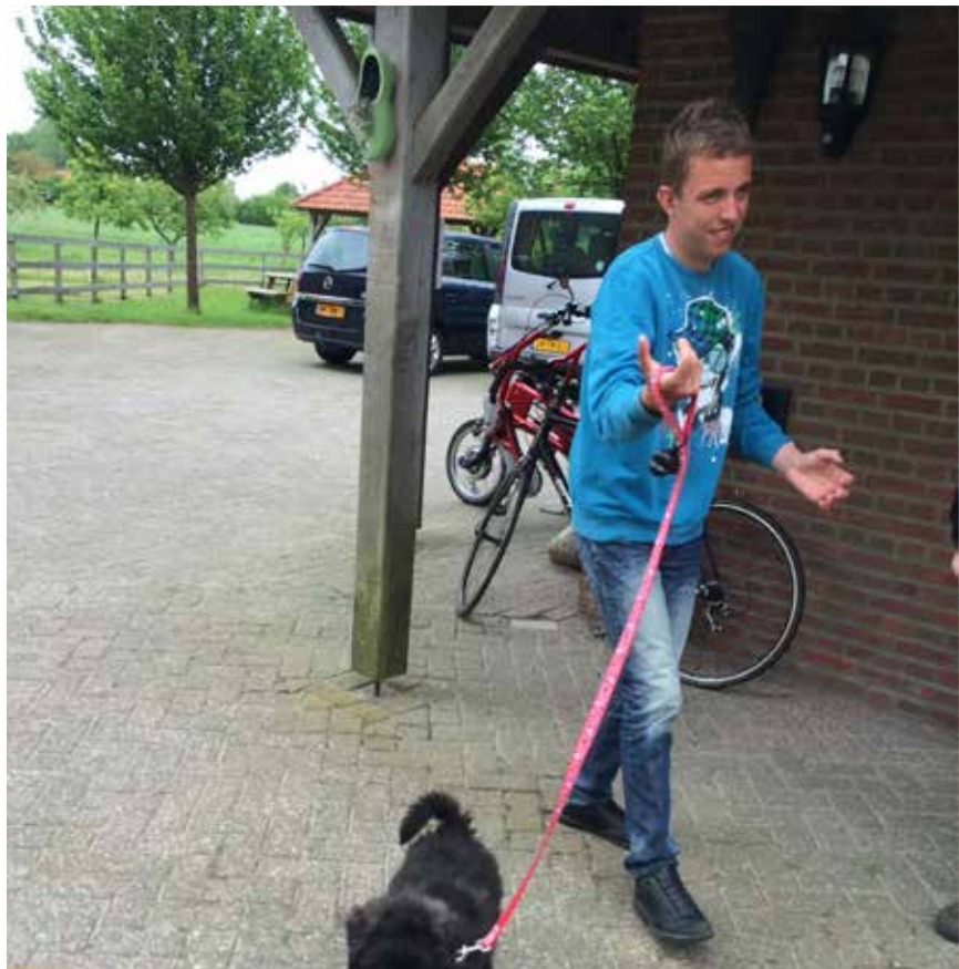
Wandelen met de jonge hond

Daarom zijn we het inloopcafé gestart. Wie wil kan op bepaalde tijden gebruik maken van deze voorziening. Soms is het druk en soms genieten slechts enkele bewoners van een rustig kopje koffie met de begeleiding.