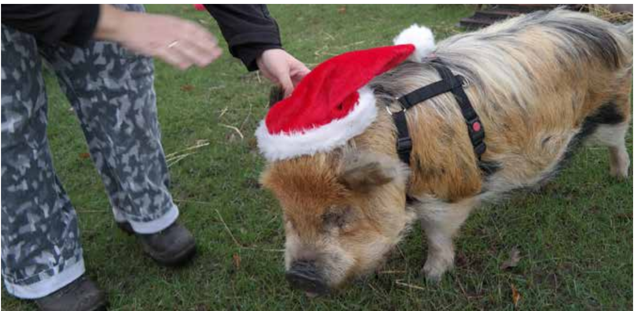
Kerstkaarten fotograferen.... het model stribbelt nog wat tegen....