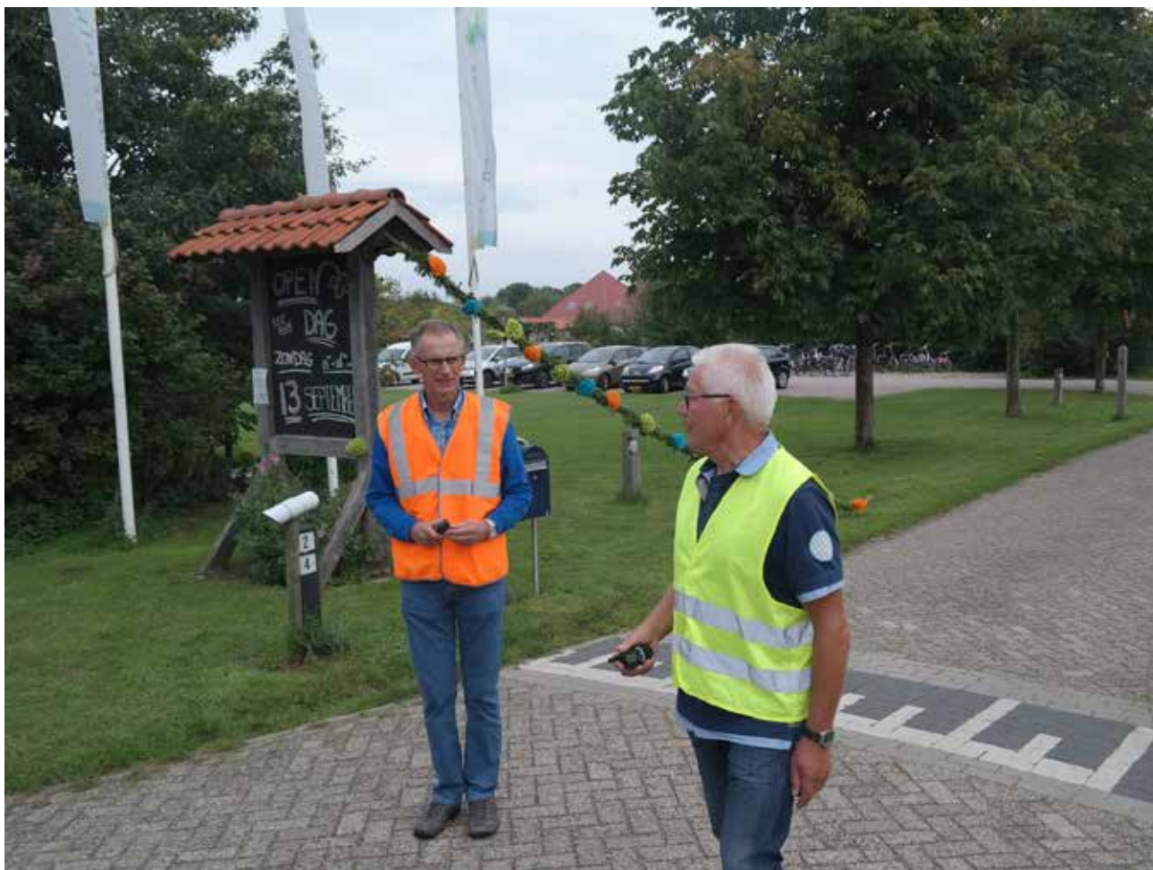
Vrijwilligers regelen het verkeer tijdens de open dag