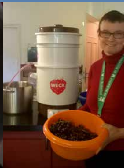
Van druiven sap maken!