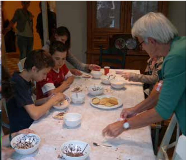
Ons RVT-lid helpt een handje