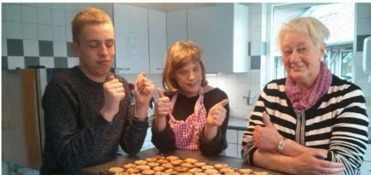
Succes! Arbeidsparticipatie is onder andere ook het ervaren van een voldaan gevoel!