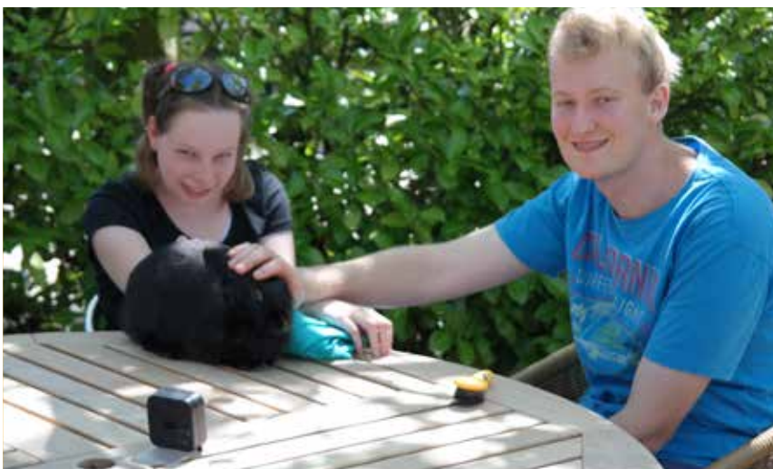
Knuffelen met de dieren