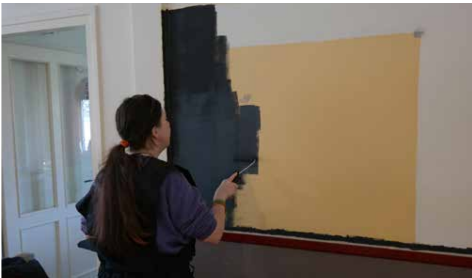
Deelnemer verft het toekomstige planbord met magneetverf

Samen met de begeleiders en de deelnemers heeft de projectmedewerker een stappenplan opgesteld hoe dit kan worden bereikt. Er moesten een aantal dingen worden aangepast. Er was meer duidelijkheid gedurende de dag nodig: deelnemers moeten weten waar ze werken en met wie. Pas dan kun je doelgericht aan de slag met de doelen die gezamenlijk opgesteld zijn tijdens het jaarlijkse zorgplangesprek. Daarom is het planbord ingevoerd.