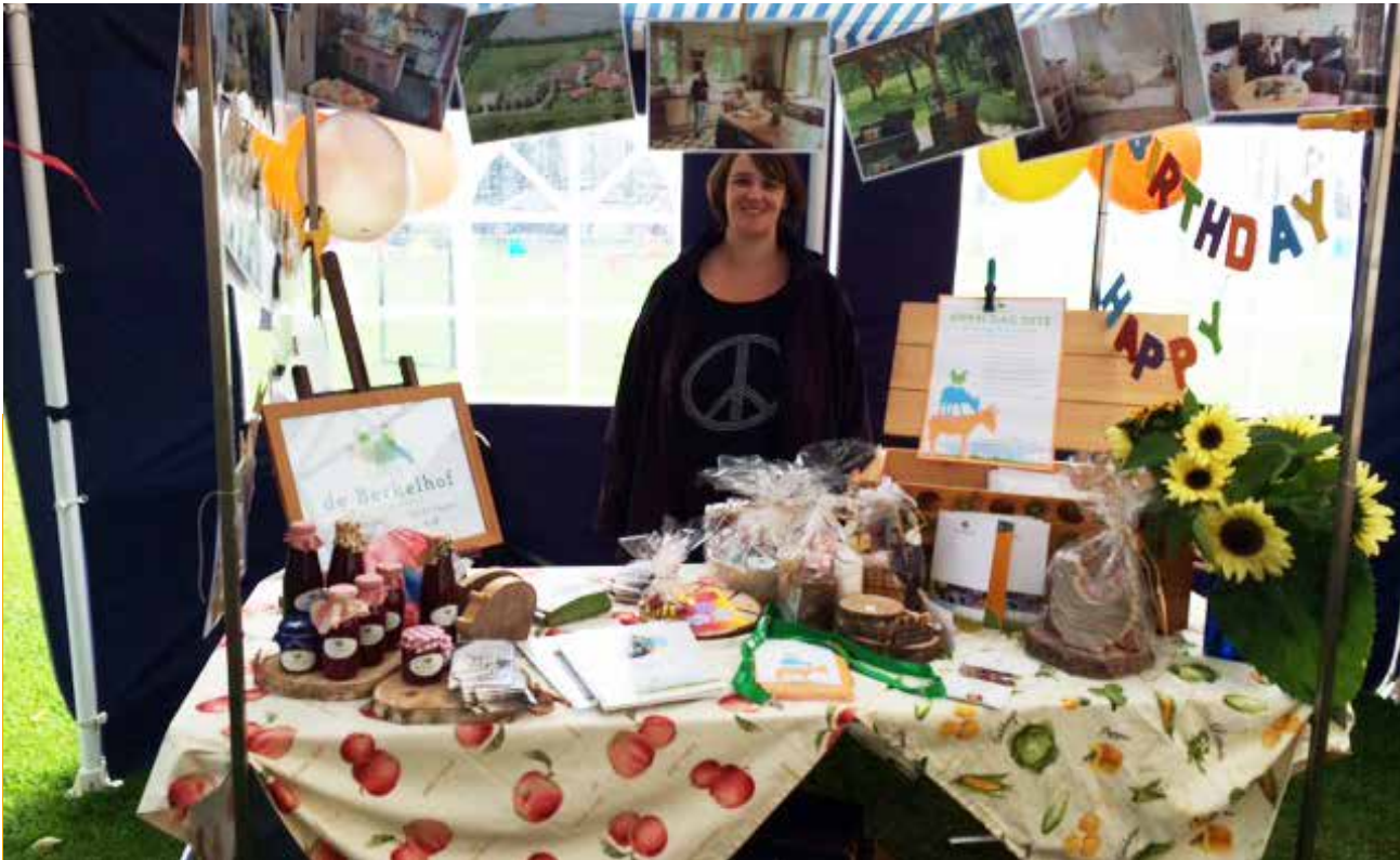
Lid van de cliëntenraad presenteert De Berkelhof tijdens de zomerfeesten in Haarlo