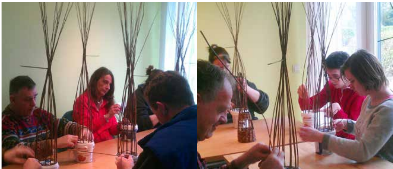
Concentratie bij de cursus wilgentenen vlechten