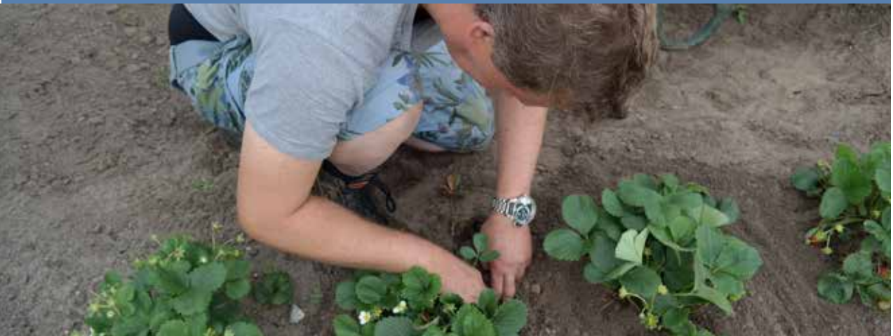
In de tuin werken