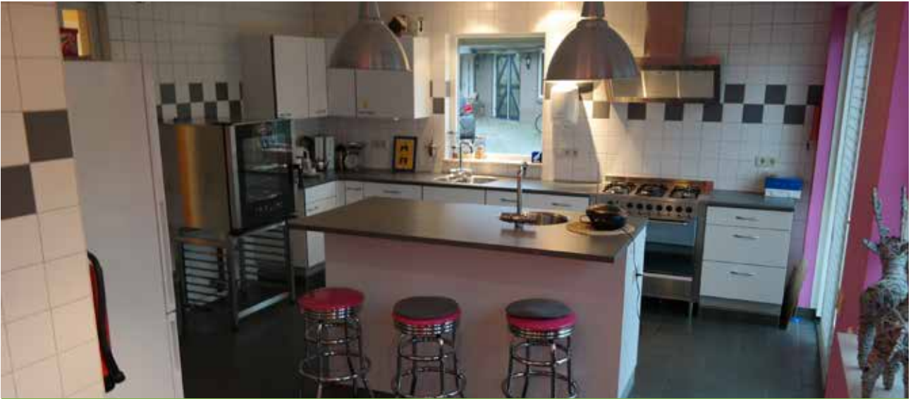
De taartkeuken. Hier stonden ooit de koeien...