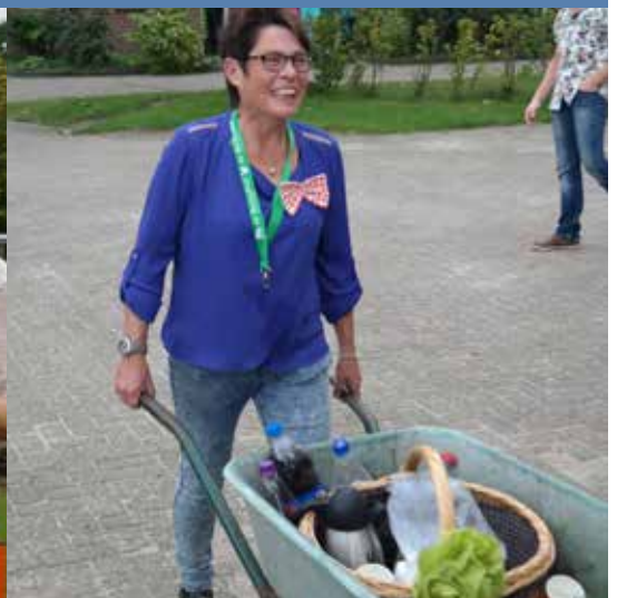
Even een kopje koffie voor de drukke helpers