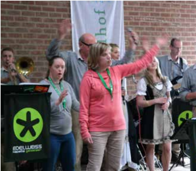
Meezingen is leuk!