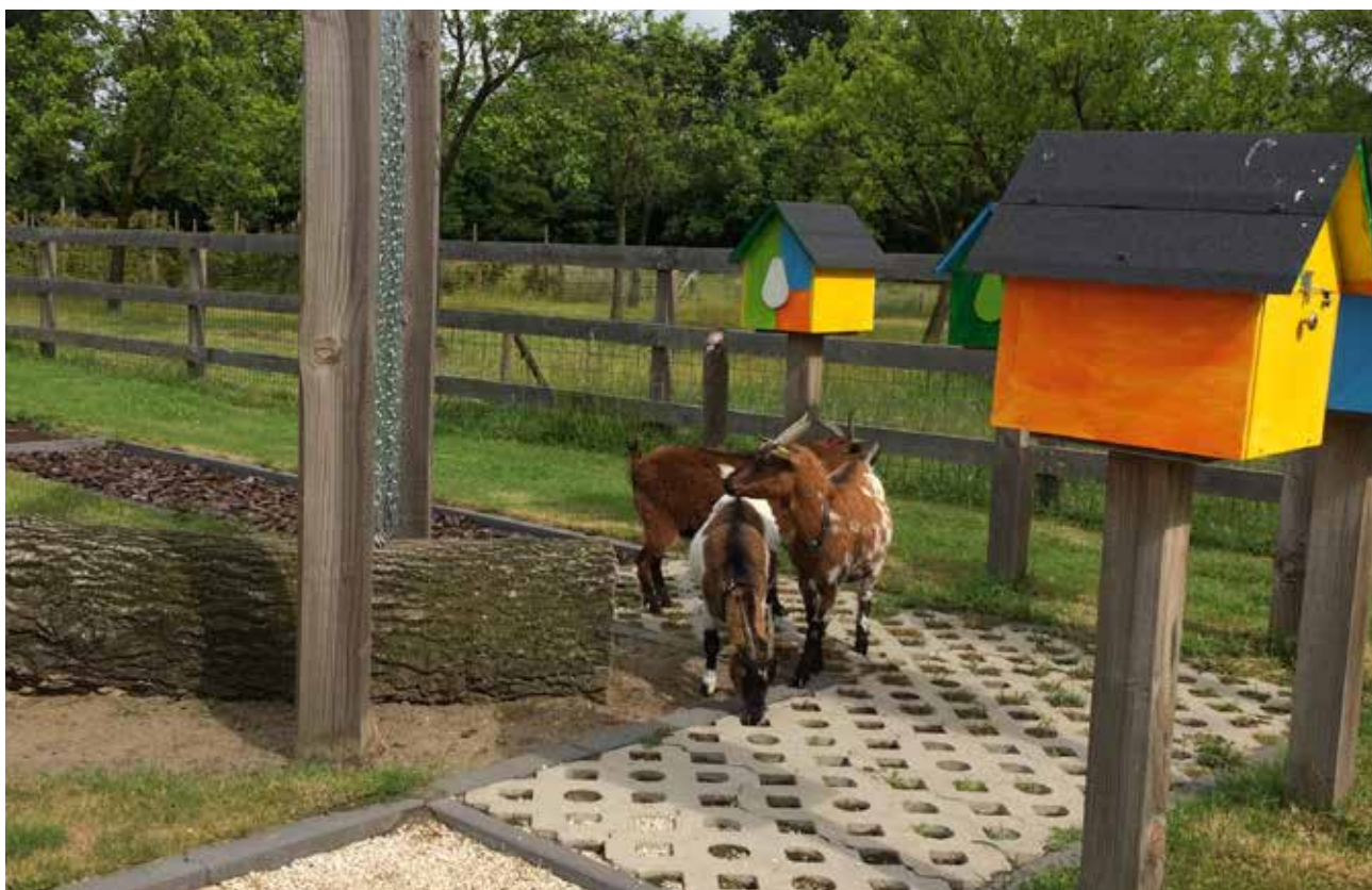
De geitjes vermaken zich prima in de zintuigentuin...alleen was dit niet de bedoeling!

Er moest een nieuw hekwerk komen voor de avontuurlijke dieren. Tijdens een spontane weekendactie hebben veel vrijwilligers geholpen en ook echtgenoten van medewerkers hebben hun zaterdag besteed om een mooi hek te plaatsen! Ook de bestrating is op deze manier onder handen genomen!