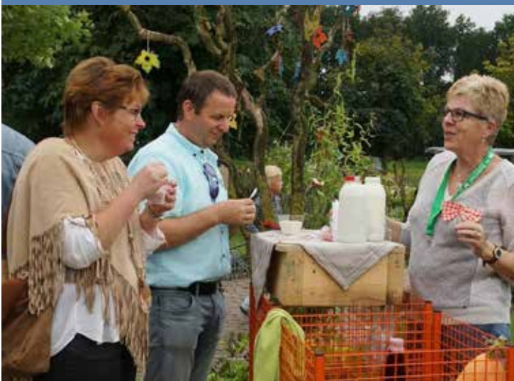
Proeven van de winkelproducten