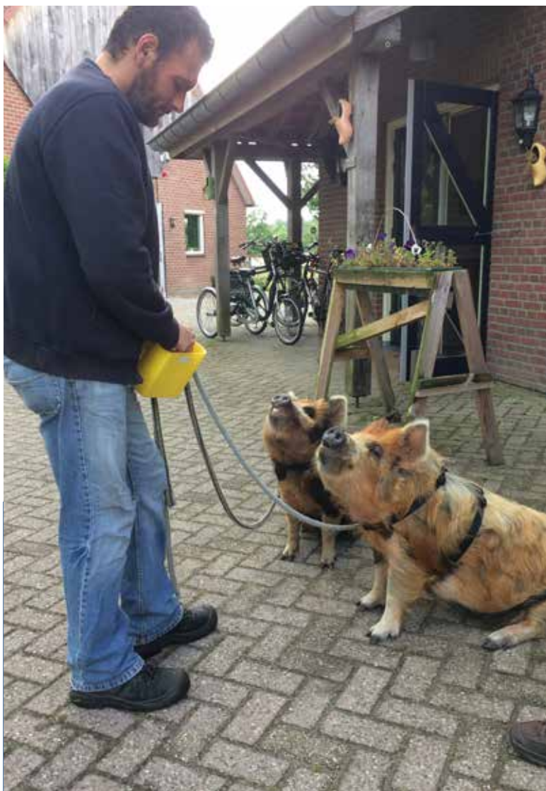
Werken met de varkens