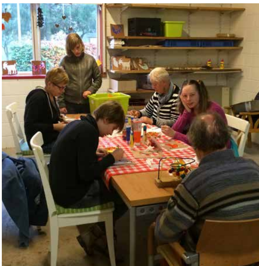
De nieuwe creatieve ruimte

Daarom is besloten om de grote werkplaats in tweeën te delen. Wel met een grote schuifdeur, zodat ook, naar behoefte, één grote ruimte gemaakt kan worden. Een prima moment om alles weer een keer goed op te ruimen en opnieuw in te richten!