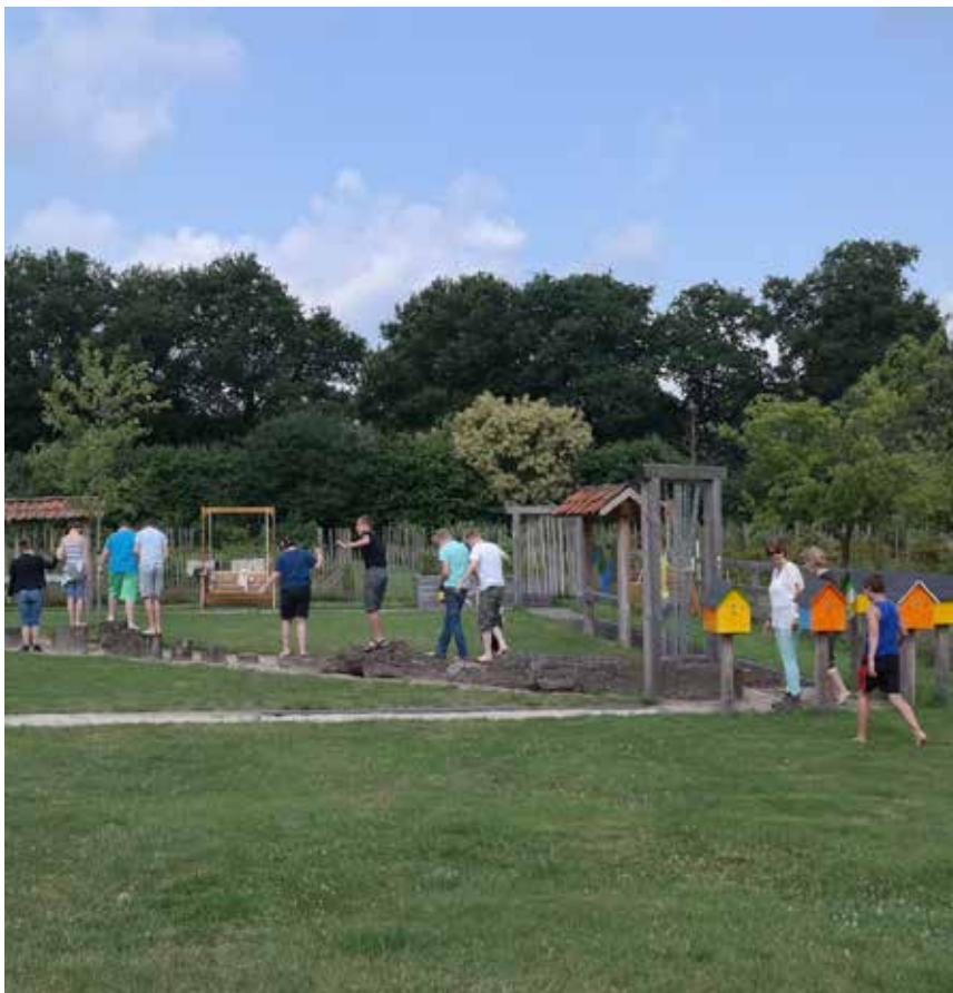
Een hele klas van de Triviant op bezoek bij een voormalig klasgenoot die nu bij De Berkelhof woont.

Daarnaast bestaat de mogelijkheid voor oudere studenten om op een andere dag een individuele stage te lopen. Ze draaien dan gewoon mee met onze dagbesteding. Het is goed dat iemand na kan denken over wat hij/zij na de schoolperiode wil gaan doen.