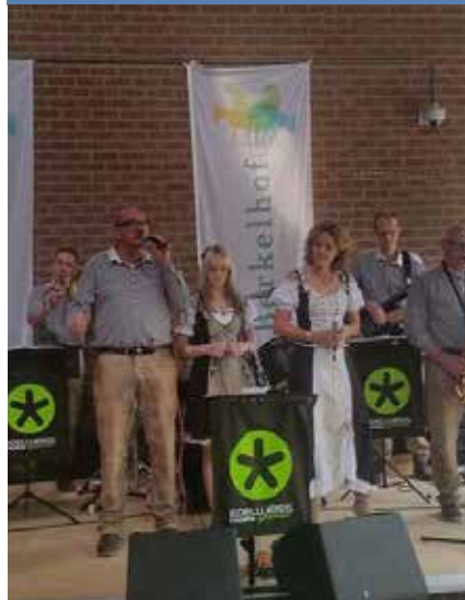
De Edelweisskapelle speelt voor ons!