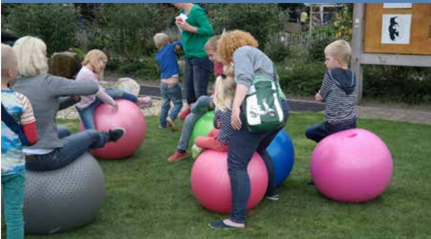
Wie kan zo maar op die bal zitten?