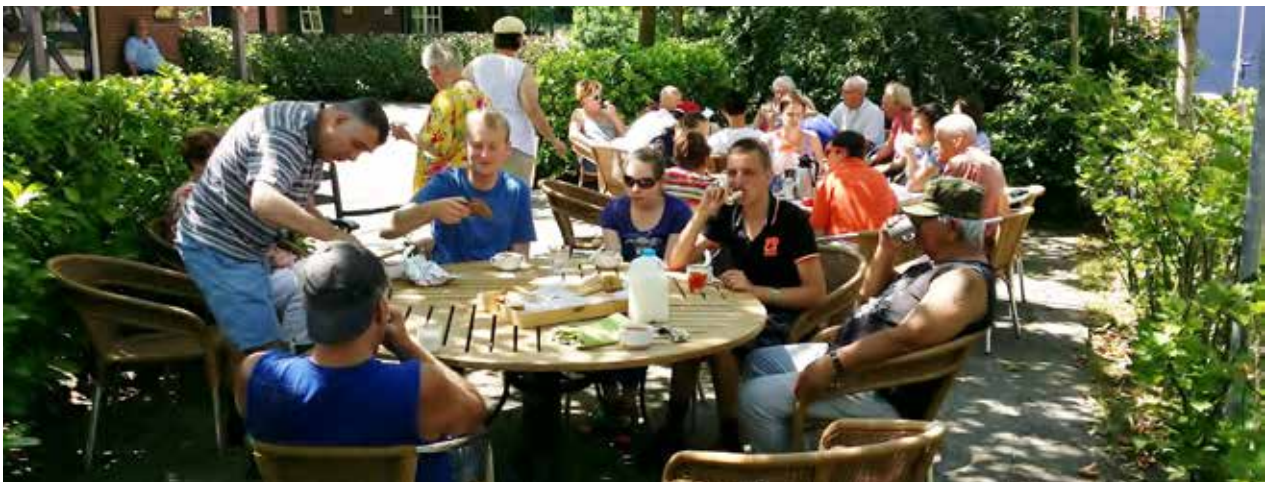
Groep dagbesteding tijdens de koffiepauze

Ja, wij hebben nieuwe deelnemers en ook bewoners. Er is zelfs een wachtlijst!