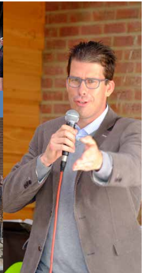
De burgemeester vertelt