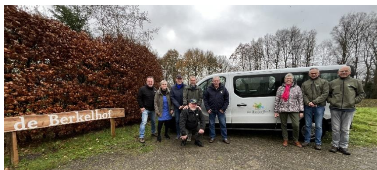
Een deel van onze vrijwilligers